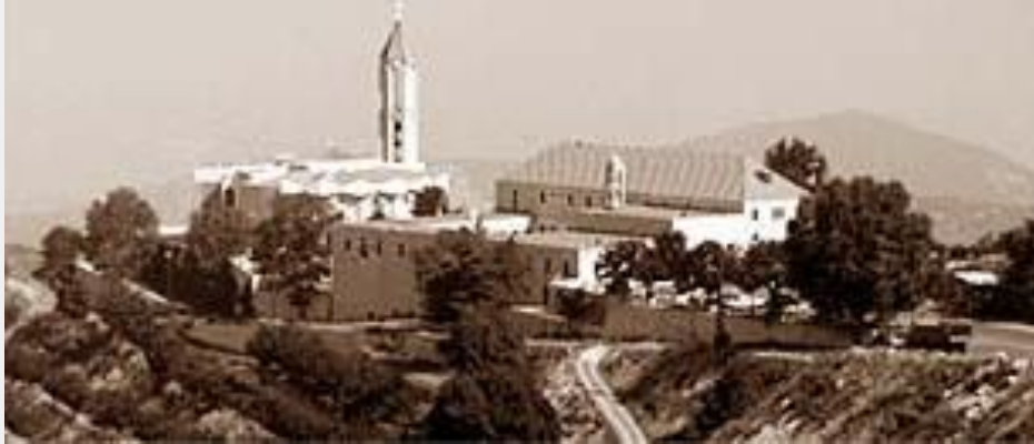
Santo mosteiro Maron-Annaya - túmulo de São Sharbel

coração, boca e as palmas de suas mãos, e manter o bramido do ruído do mundo longe de suas casas porque é como que assola as tempestades e ondas violentas: uma vez ele entra na casa, vai varrer tudo e dispersar todos. Preservar o calor da família, porque o calor do mundo inteiro não pode fazer. " (St. Sharbel's palavras)